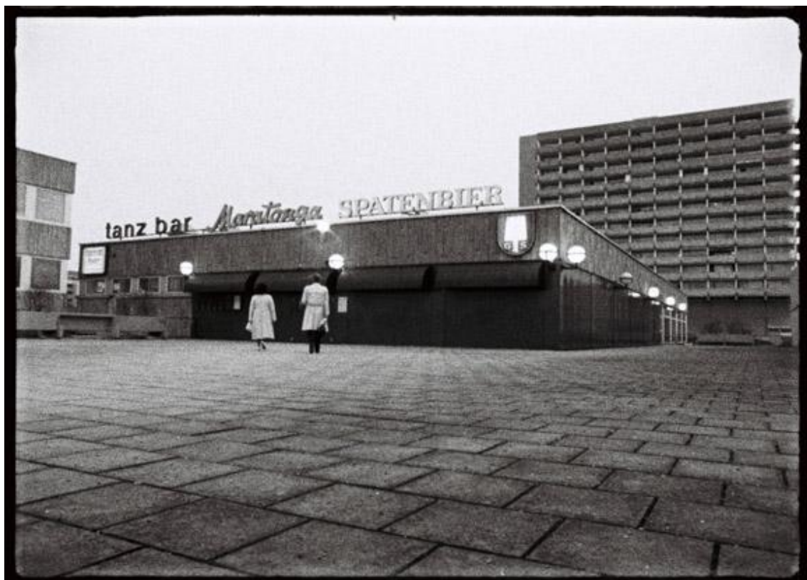
Scan vom 16mm Negativfilm