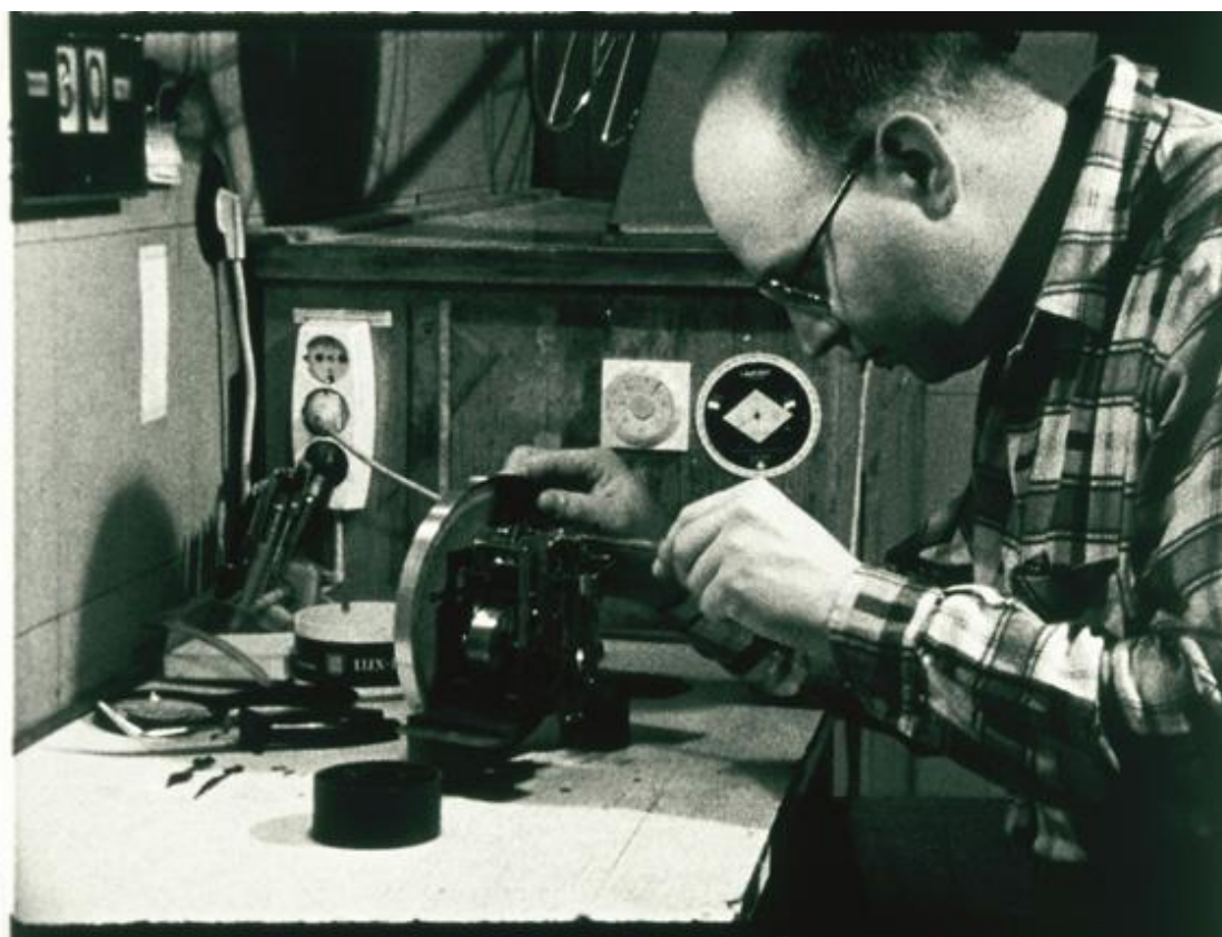
Scan vom 16mm Positivfilm