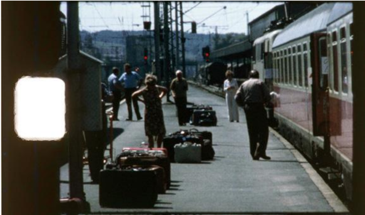
Scan vom Super8 Positivfilm

Mehr zu den Bildern und Beispiele in voller Qualität findet sich im Downloadbereich (www.lusznat.com)