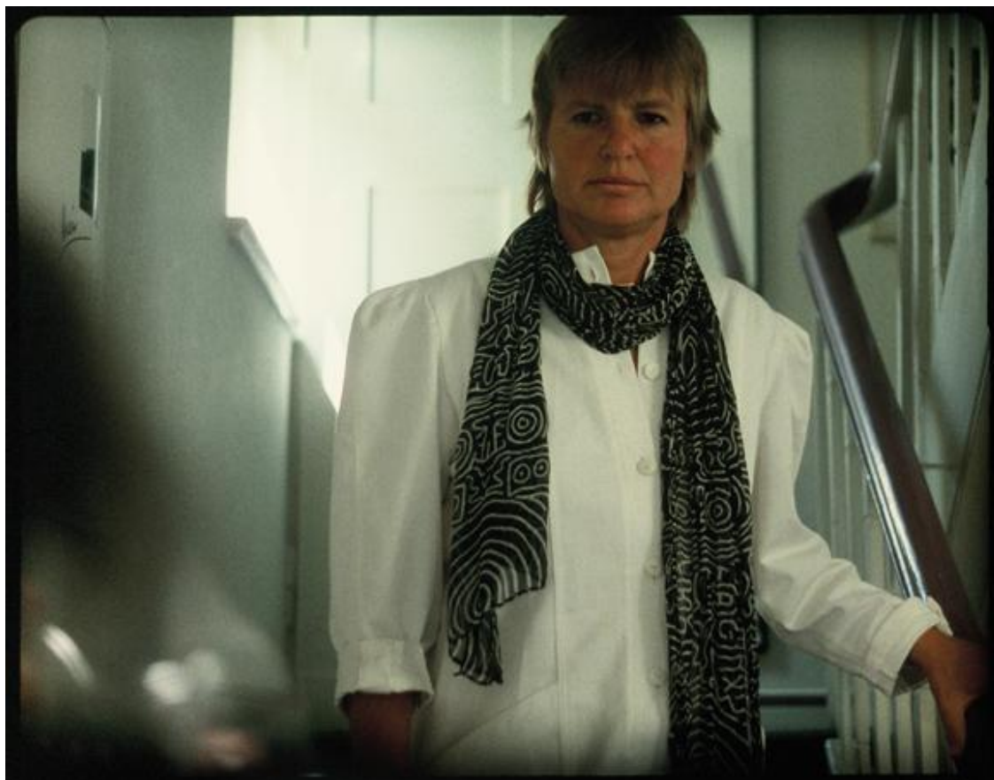
Scan vom 35mm Positivfilm