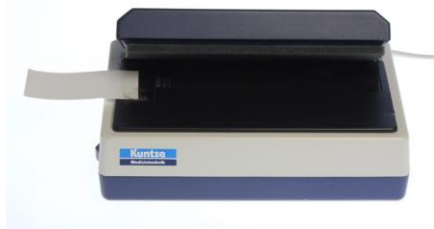
Kuntze Sensitometer RS601 mit 21 Stufen Graukeil 0.15 D

Auffallend ist, dass die Dichte der gleichen Graustufe des Graustufenkeils in der Abfolge der Filmspiralen im Tank von unten nach oben hin zunimmt. Da alle Graustufenkeile sich jeweils am Anfang des Films befinden, sind sie in der Dose nah zum Achsrohr hin platziert. Das bedeutet, dass in einer großen Entwicklerdose bei Anwendung der Kippmethode der Entwickler ein gleich belichtetes Filmstück unterschiedlich entwickelt, und zwar entsprechend seiner Position vom Boden hin zum Deckel mit kontinuierlich steigender Dichte. Um zu überprüfen, wie sich die Strömungen innerhalb der Dose auf die Gleichmäßigkeit zwischen innerem und äußerem Teil der Spule auswirkt, habe ich eine 120 Meter Rolle Orwo NP Kinofilm mit einer Arriflex 435 Filmkamera gleichmäßig auf Grau belichtet daraus 8 Film-längen geschnitten und in der Dose bei gleicher Methode entwickelt. Auch hier war festzustellen, dass von einer Gleichmäßigkeit der Entwicklung nicht gesprochen werden kann.