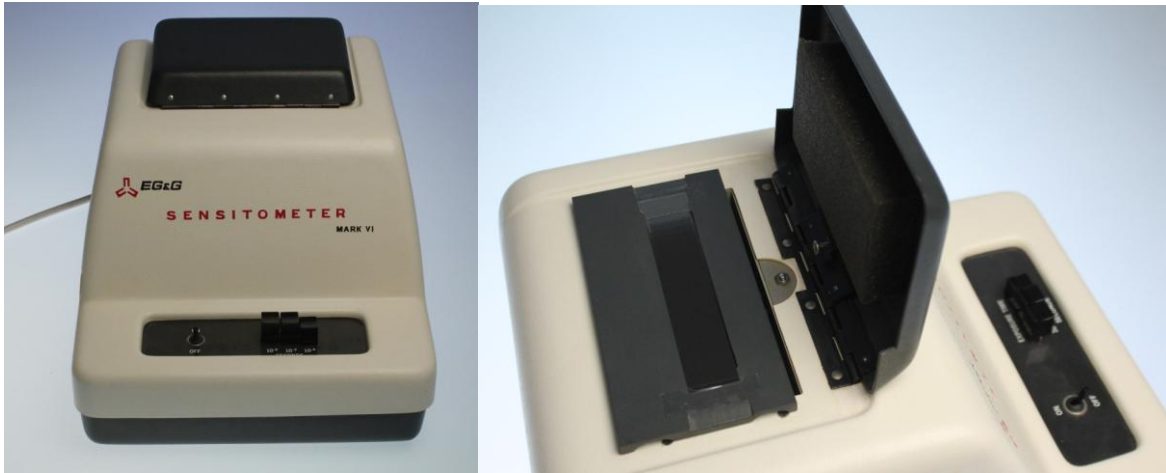
EG&G Sensitometer MarkVI mit Tageslicht-Blitzlichtquelle

Graustufenkeil No.2 (0.5 bis 3.05 Dichte) und 10^{-4} Belichtungszeit.