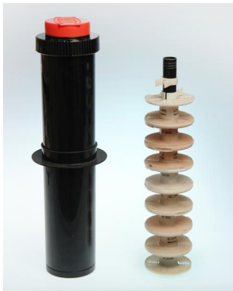
Jobo RO4314 Tank für 10 x 35mm Spulen