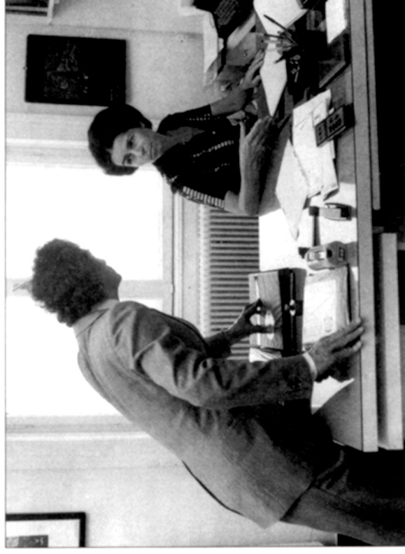
Wer sich so über den Tisch lehnt, verletzt das Territorium des anderen!