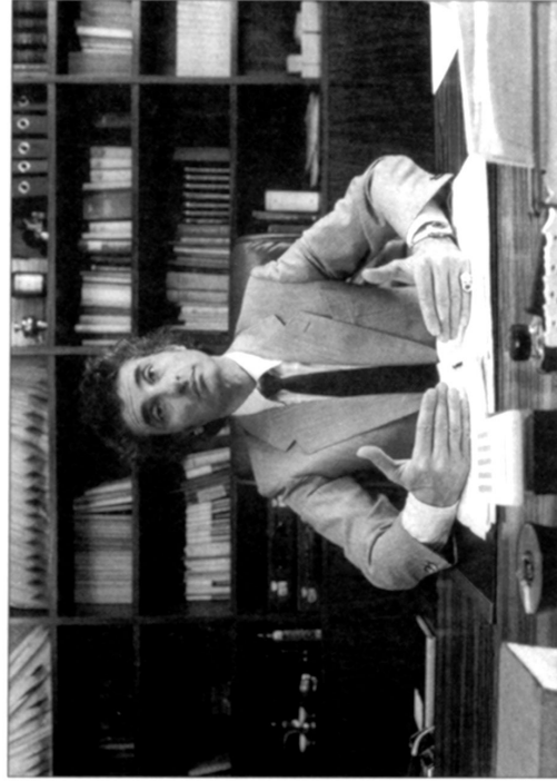
Die Finger setzen eine Grenze unter den Pfeilern der Daumen; Bis hierher komme ich entgegen, doch nicht weiter.