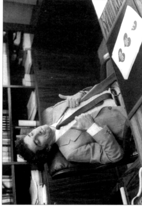
Die gerechten Dominanzdaumen demonstrieren Selbstzufriedenheit.